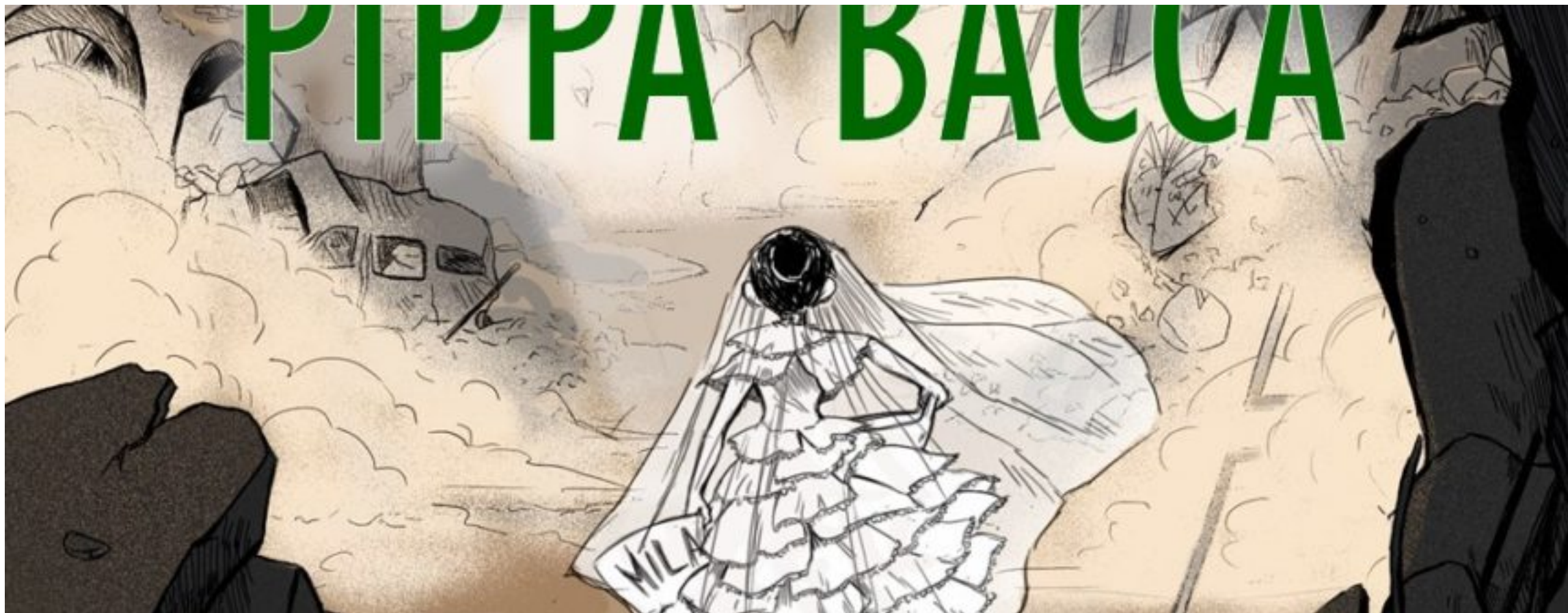
( http://www.corrieredellospettacolo.net/wp-content/uploads/2019/05/Locandina-x-social-orizzontale.jpg )

Home ( http://www.corrieredellospettacolo.net/ ) / Da Sapere... ( http://www.corrieredellospettacolo.net/category/da_sapere/ ) / TU NON MI FARAI DEL MALE – Spose in viaggio. Il sogno necessario di Pippa Bacca